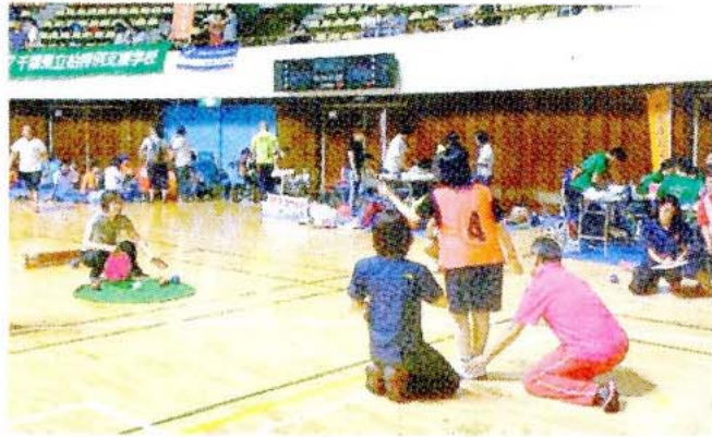
【中学部 Tスロー 試合規定】